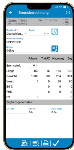
Die App Train Check automatisiert die Zugabfertigung und übernimmt die Bremsberechnung

Die App Train Check von zedas@cargo ermöglicht die papierlose Zugabfertigung. Mit der App werden viele Prozesse automatisiert, wie beispielsweise die Eingabe von Daten, Wagennummern und Zugzusammenstellungen und das Erstellen von Wagenlisten und Bremszetteln. Durch die Nutzung der App können Mitarbeiter ihre Aufgaben vor Ort erledigen und dokumentieren. Gleichzeitig ist die Leitstelle jederzeit in Echtzeit über den aktuellen Status informiert. Über TAF Schnittstellen sind Wa-