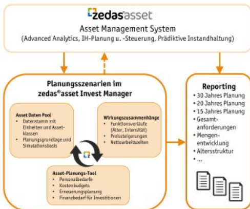
Integration und Funktion des Moduls zedas@asset Invest Manager