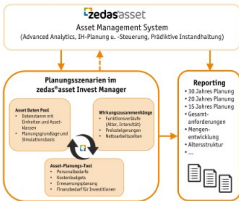
Integration und Funktion des Moduls zedas@asset Invest Manager